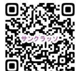
同園パンフレットより一部抜粋

場まで」という英国の古いスローガンを思い出しました。 …と、その「中身」はなかなか「深い」ものなのでした。 そしてまた、スタッフの方々が実際に同園支援者の方に事業内容の説明をする場面に同席する好機がありました。 ●ペットがいるために施設に來られないお年寄りがいらっしやいます。それは残念である、というよりも大変な問題だと思われました。●ペットと一緒にいることで元気になるんです。家族の一員なんです。●フランスでは地下鉄と一緒に乗ることが出来ます。●(災害対策の)避難所もペット対応が必要なんです。●社会全体の大きなテーマだと思えます。 同園スタッフの方々の温かきできめ細やかな思いが、業界の先駆者となるようなこの新規事業のスタートに繋がったのだということが腑に落ちた瞬間でした。 ところで、犬と一緒に散歩はとても健康に良いそうです。 それは心のふれあいがあり、楽しさがあり、変化があり、モチベーションが堅