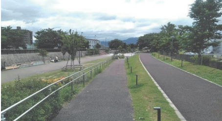
「区間5：de愛ひろば」を望む

令和元年冬頃から猛威を振るったコロナ禍により一時期は停滞するも、前年の平成30年にはこの2つの区間を合わせて70万人もの来園者数を数え、今後も順次、新たな区間が整備されていく計画のこの区間です。 今回は、平成29年に開園した「区間2：あいさつひろば」読み：あいさつひろば「区間5：de愛ひろば」を望む