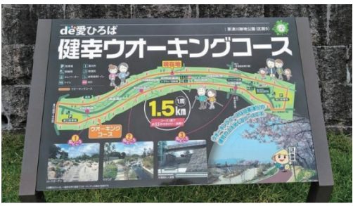
「de愛ひろば」に設置されている「健幸ウォーキングコース」マップ